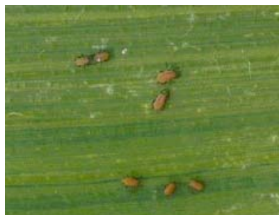
pucerons sitobium avenae

- 100 pucerons par plante après 8-10 feuilles.