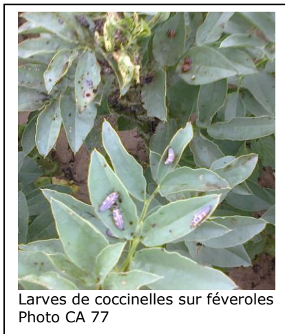
Larves de coccinelles sur féveroles