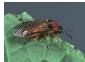
Tenthrède adulte

Piégeage des premiers individus à Jablines (source BSV) il s'agit d'adultes mais pas encore de larves.