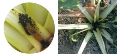
Dégâts de teignes : feuilles du cœur noircies, présence d'amas noirs dans le bas des pétioles ou collets.