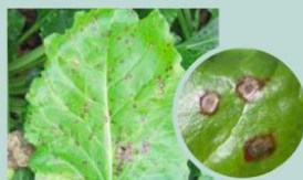
Petites taches rondes grises, avec bordure rouge ou brune avec au centre des petits points noirs