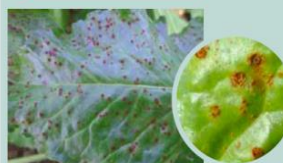
Taches pulvérulentes orangées à brunes