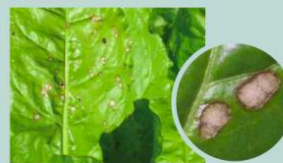
Taches assez grandes, marrons sur l'extérieur, avec au centre des points blancs