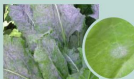
Feuillage blanc ; les premières étoiles sont souvent peu visibles