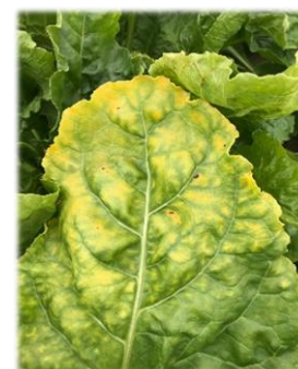
Symptômes de jaunisse sur feuille (CARIDF)