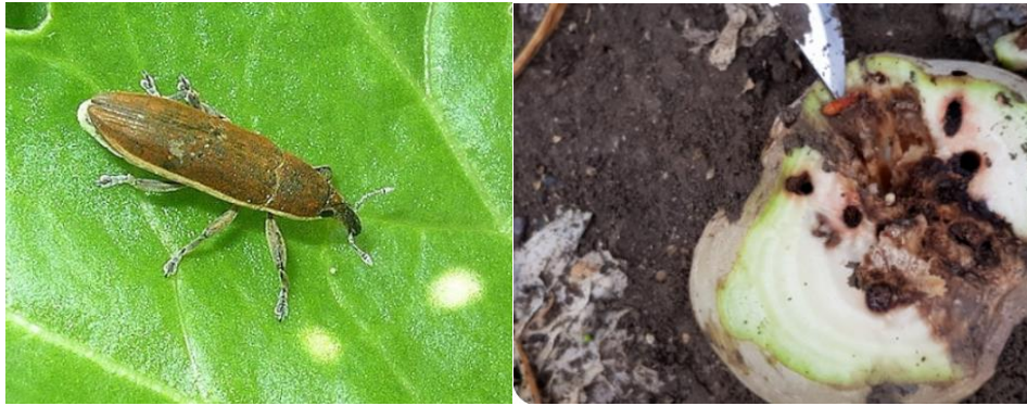
Charançon Lixus juncii (adulte) et dégâts dans le collet provoqué par la larve.